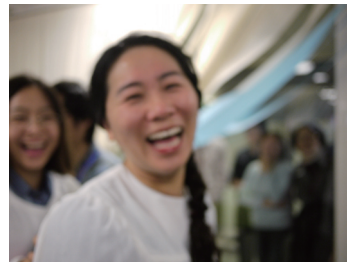
2013 Chemnitz 讀經生活營受洗

每週日的晚上，我會到體育館打籃球。一方面能夠運動，另一方面也可以認識很多學生（那是專門給華人同學的時段）。因為我的年紀較長，加上打球的經驗，使得我有機會成為“大哥教練”的角色，也有機會邀請其中的一些同學來參加團契。這給了我一個很大的啟示，你永遠不知道神會怎麼使用你的過去（你的現在）。我們應該以一個未來領袖的方式來過我們現在的生活！為神建造自己！