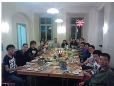
聖誕節與語言學校學生一同聚餐