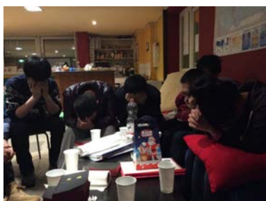
跨年禱告會，感謝，新年展望