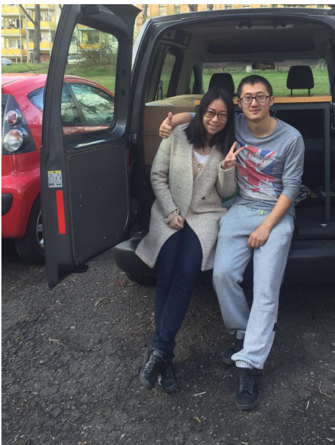
幫助一對即將結婚的年輕人搬家

感謝神豐富的預備和弟兄姊妹的支持, 我們終於買了一輛車。除了我們家庭更加便利, 每次到鄰近城市傳福音也不再需要趕火車。最近也幫了一對剛畢業即將成立家庭的弟兄姊妹搬了家, 希望這部車能夠成為更多人的祝福:)