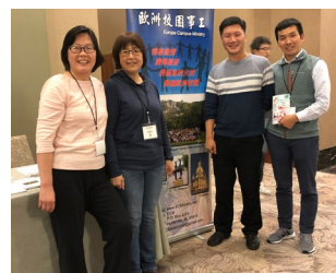
頌輝在芝加哥華人基督徒大會期間在ECM攤位與同工留影。