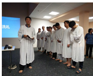
2018德東冬季門徒造就營共有八位弟兄姐妹受洗