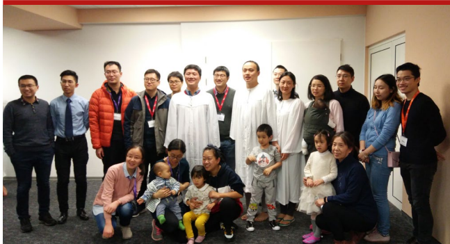
在冬季門徒造就營中與德累斯頓受洗的肢體及團契成員合影

不是我要，不是我好，是祢用真理把我心光照； 讓我看到，今世有永恆榮耀， 吸引我到這條路上奔跑。