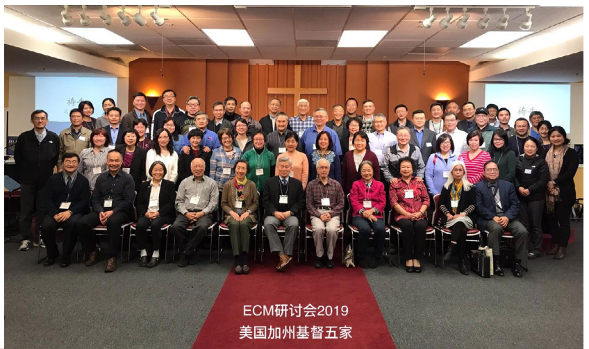
ECM研討會2019 美國加州基督五家