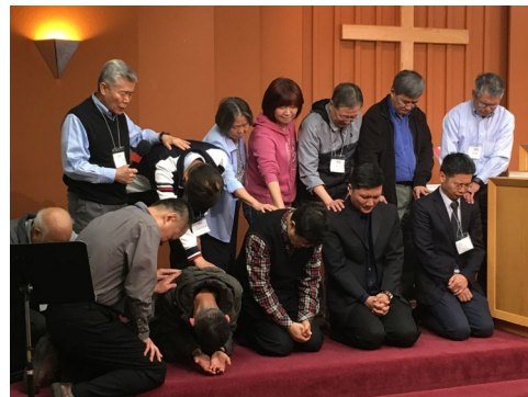
ECM 宣教士 聯合差派禮