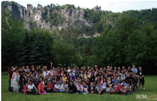
(2011年ECM 歐洲校園事工“小瑞士”福音營)

說到這次營會的內容，那真是一場屬靈的盛宴。一堂堂精彩的生命講道，一個個感人有趣的故事背後，更是讓