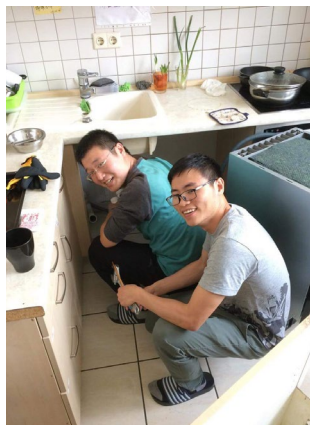
科騰弟兄們一起修理洗碗機

這個學期看到神的很多帶領，在明確的分工下，弟兄姊妹各司其職，新加入的同工也帶來新氣象。我們團契與德國團契的關係緊密了許多，共同組織“國際之夜”，“書本桌（派發聖經和福音單張）”，一起向不同族裔的學生傳福音。兒童主日學重新啟動，愛宴有條不紊，禱告會也開始有復興的跡象。但是就在一切都看起來蒸蒸日上的時候，撒旦的攻擊隨之而來... 首先是一位主要同工生命當中連續地面對好多個比較大的困難，可能需要離開德國，以至於心力交瘁，申請退出同工。兩個同工姐妹之間，突然因為一些小事爆發衝突，甚至到了無法共事的狀態，其中一位也退出同工会。另一個在其他城市的姐妹，也因為在各樣的壓力下有自殺的想法，還好及時發現，幾位同工一起趕到她所在的城市，和她好好地聊了一聊，再帶她回到我們所在的城市，陪伴了幾天。團契的聯繫人和德國團契也因為溝通方式不同的緣故有了一些誤會，關係有點緊張。這些事加上鄰近考試月，團契突然又沒了生氣... 這段日子神似乎在教導我們關於祂自己時間的功課，我們人總是期待看到即刻，大幅度的改變。但是神有時候派給我們的職分就是負責預備材料和澆灌，開花結果不常是學生事工能夠看見的。但是神是信實的，我們需要做的是在祂的面前忠心，就一定能看到祂的作為和榮耀。