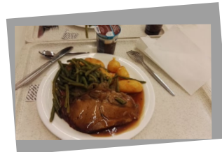
(科隆大學食堂和慕道學生共用午餐)