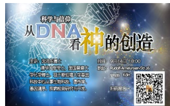
基督之家第三家短宣隊