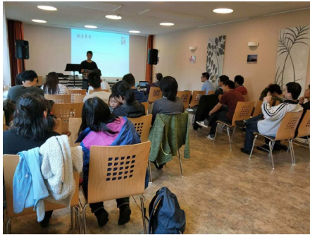
九月份一位弟兄在離開我們以前做的見證（之後照片中又有四位弟兄姐妹離開）

過去的幾個月，德國不太安寧，連續兩起外國人殺死德國人的事件（其中一件就發生在我們所在的城市），使得德國的東部排外情緒高漲，多次遊行和一些小規模的暴動，雖然還不至於明目張膽的歧視或者在光天化日之下做出激進傷害人的行動，但外國人總是人心惶惶，感覺到