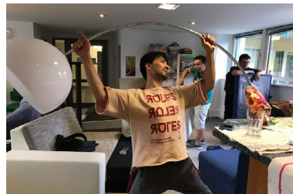
學生事工就像是重新佈置房間一樣，一直不停的更換組成的部件，搬進搬出，重新調整彼此的位置，重新認識自己的定位。