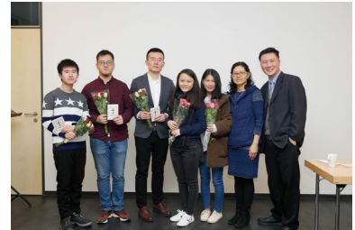
11月24日，德累斯頓團契給五位弟兄姐妹施洗