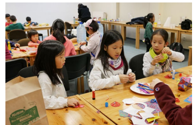
孩子們在營會的兒童主日學擔任小老師