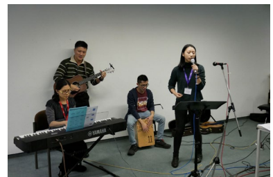
德累斯頓團契敬拜團在營會中服事