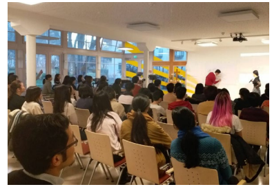
頌輝受邀在柏林的華人教會進行聖誕節漫畫佈道