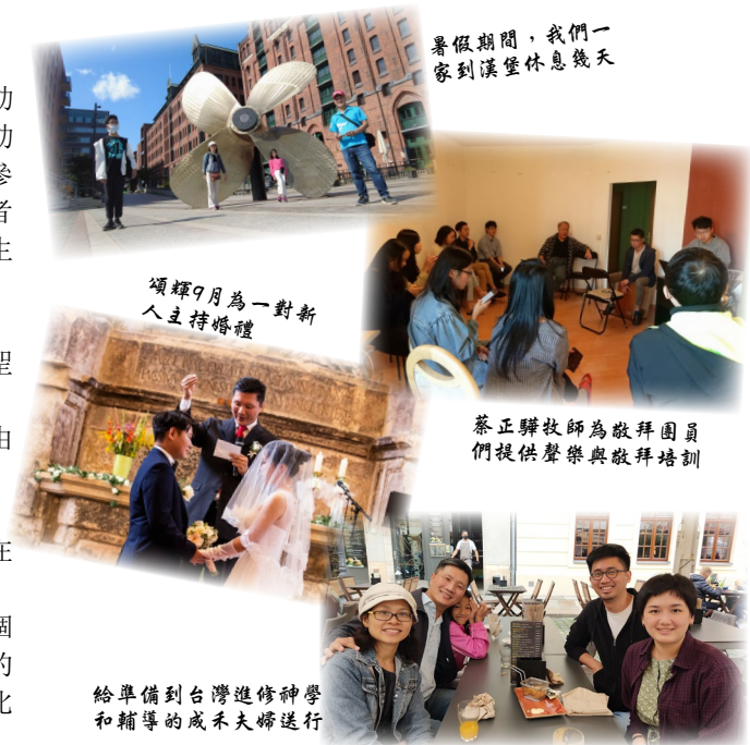
暑假期間，我們一家到漢堡休息幾天