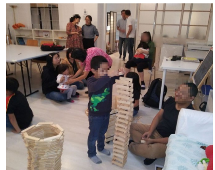
主日下課後一起玩積木不想回家