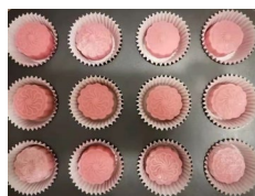
師母自製愛心月餅